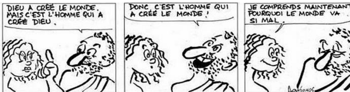
Les dangers du syllogisme...